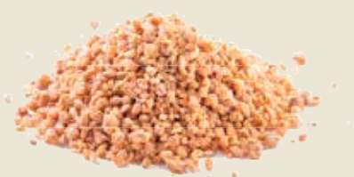
■ אגוזי קשיו