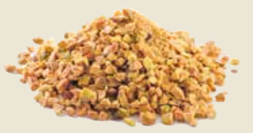
■ אגוזי פיסטוק