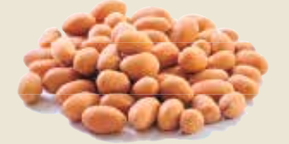
■ בוטנימוס אמריקאי (בוטנים אמריקאים)