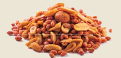
■ אלמנדוס - תערובת חמניות ובוטנים מצופים פיקנטית