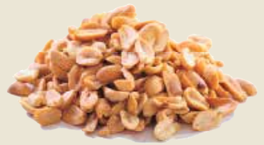
■ בוטנים מטוגנים