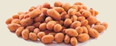
■ בוטנימוס גריל (קבוקים גריל)