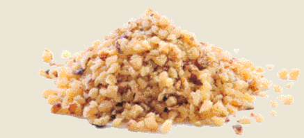
■ אגוזי מלך