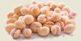
■ בוטנימוס (קבוקים)