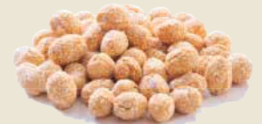
■ בוטנימוס שומשום (קבוקים שומשום)