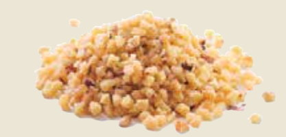
■ אגוזי לוז