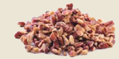
■ אגוזי פקאן