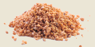
■ אגוזי לוז